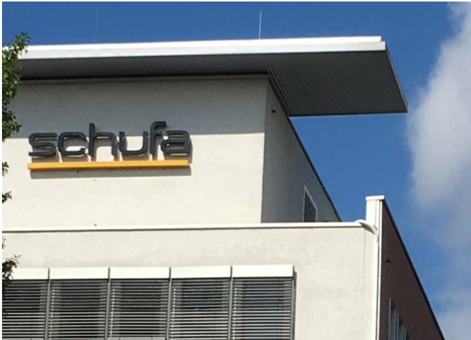
SCHUFA-Hauptgebäude in Wiesbaden: Die Übernahmepläne durch EQT sorgen für Wirbel.

Das Bundeskartellamt hat am 7. Februar 2022 zwei Zusammenschlussvorhaben freigegeben, die im Zusammenhang mit dem aktuellen Bieterwettbewerb um Anteile an der SCHUFA Holding AG zur Fusionskontrolle angemeldet wurden.