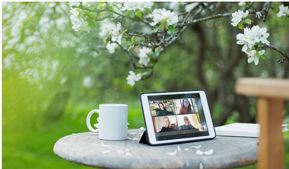
Persönlicher Kontakt: Seit Corona Fehlanzeige.