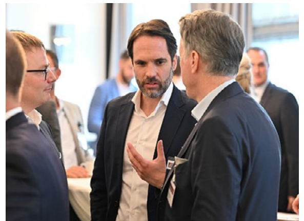
Gelegenheiten zur Vertiefung der Themen und zum Networking nutzen die Konferenzteilnehmer ausgiebigst in den Kaffee- und Kommunikationspausen sowie beim gemeinsamen Abendessen in der Düsseldorfer Altstadt.